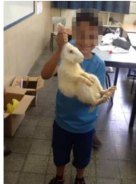
בעלי-חיים המוחזקים בפינות ליטוף חשופים למגע של עשרות ומאות ילדים – שרבים

בישראל קיימות פינות-חי ופינות ליטוף רבות, ובניגוד למשקים חקלאיים, שם מוכתב למיליוני בעלי-חיים יחס אחיד, הנובע ישירות מן המחקרים האחרונים בתחום הרווחיות הכלכלית-חקלאית, שונות פינות-החי והליטוף זו מזו. פה ושם ישנן "פינות" המעניקות לבעלי-החיים תנאים סבירים, ולעתים נדירות יותר – אף יותר מסבירים. אולם על-פי רוב מוכתב היחס לבעלי-החיים מעצם מטרתן של פינות-החי או הליטוף.